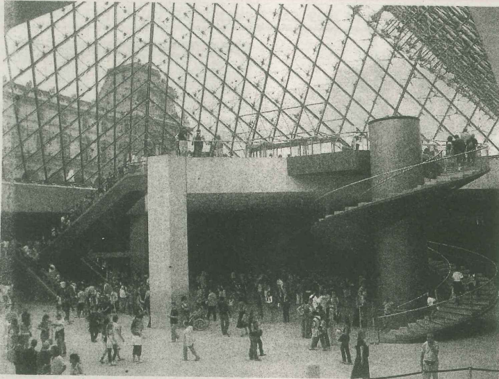
■ El patio del Museo del Louvre por la noche, con la Pirámide mostrada en el centro.

Días pasados, salió publicado en un matutino nacional un artículo recordando el aniversario número 20 de la Pirámide del Museo del Louvre. Se menciona este edificio del arquitecto I.M. Pei, para destacar cómo los franceses supieron incorporar arquitectura contemporánea en un conjunto ecléctico y que sirvió para resolver un viejo problema de acceso y organización funcional.