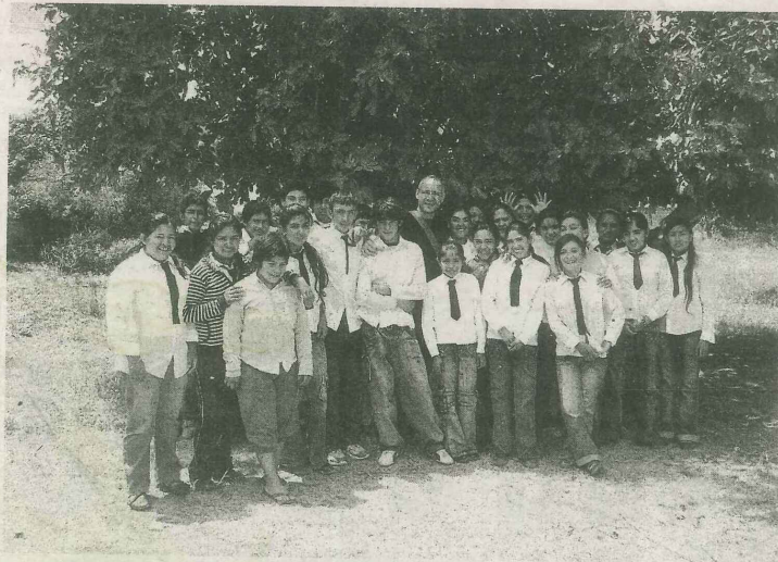
■ Los chicos de La Puntilla retratados bajo una higuera de su escuela.

Cuántos obstáculos colocamos los ciudadanos en estos 25 años de democracia, en este difícil camino de la construcción de ciudadanía ¡Qué fácil hubiera sido si no hubiéramos perdido el tiempo en pensar cómo hacer para entorpecer la obra del puente! Cuánta discriminación todavía existe en nuestras ciudades hacia los discapacitados, los homosexuales, los que profesan otra religión, los que son "distintos" ¡Qué afán el nuestro por separar! ¡Qué liberador sería para nuestra sociedad tender el puente de la integración! ¡Qué felices nos haría! Todavía existen en nuestras ciudades padres que aconsejan a sus hijos a no juntarse con otros chicos porque viven en entornos diferentes a los suyos; ni mejores ni peores, solamente diferentes ¡Cuánto miedo! Seguramente aquel 10 de diciembre de