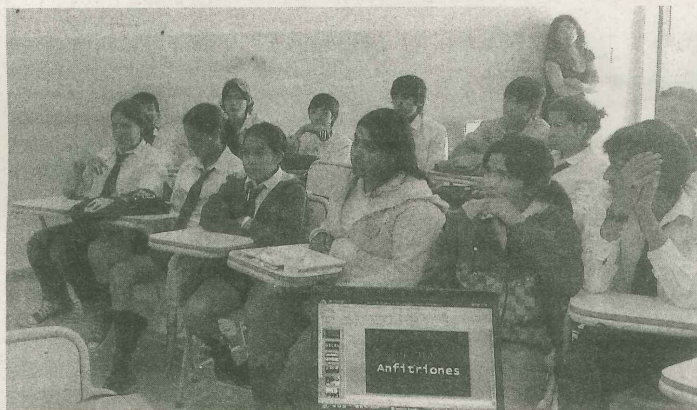
■ Los chicos participan con entusiasmo.

concorre a todos los talleres -sin faltar a ninguno- para aprender la mecánica y la rutina, que permitirá ponerlo en práctica en los próximos años en forma sistemática e ininterrumpida. Algo que lamentablemente no se dio en SFVC, ya que no quedó personal capacitado para desarrollarlo en los años subsiguientes, según el plan propuesto en su oportunidad por A vos Ciudad.