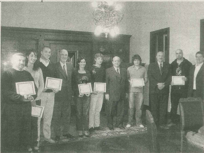
■ Los ganadores del concurso fueron recibidos por el Gobernador.

social del territorio. Revitalizar los recursos locales y generar nuevos recursos complementarios, incentivando la autosuficiencia del sistema regional dentro del sistema global.